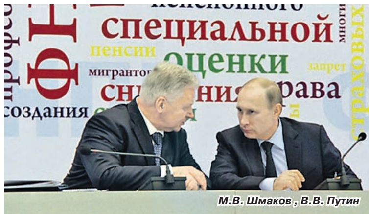
М.В. Шмаков, В.В. Путин

Затем выступил Президент РФ В.В. Путин. Он высоко оценил ту роль, которую играют профсою- зы в обществе, и согласился с тем, что нельзя перекладывать на